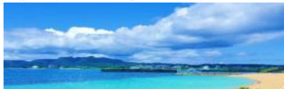
↑香村さんの出身地、沖縄県名護市の名護湾！

A.常に素直に、常に謙虚に、日々周りに感謝しながら、前向きにお仕事に励み、より一層前進できるようにこれからも頑張っていきたいと思いますのでご指導、ご鞭撻の程よろしくお願い致します。