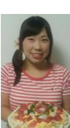
大好きな料理☆ マグロとホタテのちらし寿司を作りました！

A.商品説明や呼びかけをがんばっているのに販売に繋がらないスタッフさんをしっかりと手助けできる巡回スタッフになれるように頑張ります。